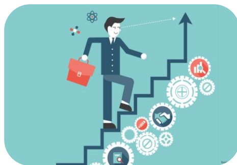
Pomoc w wyborze ścieżki edukacyjnej