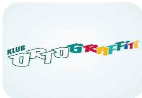
Stałe zajęcia Klubu Ortograffiti