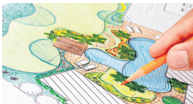
Technik architektury krajobrazu to zawód z przyszłością