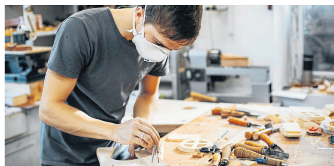
Stolarstwo daje wiele możliwości zatrudnienia, a fachowcy są bardzo poszukiwani