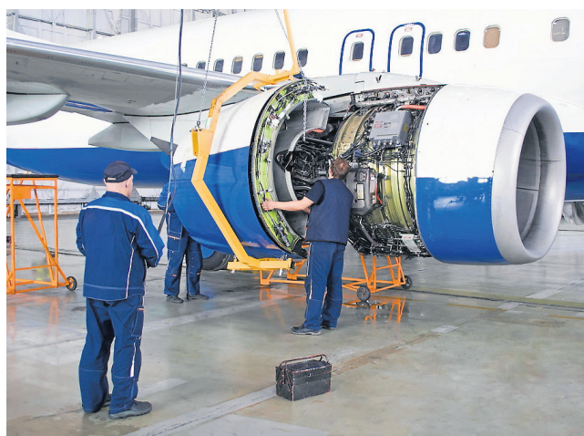
Technik mechaniki lotniczej to wymagająca, ale niezwykle ciekawa profesja

Specjalista w tym zawodzie umie: ● przygotować konwencjonalne obrabiarki skrawające do obróbki ● wykonać obróbkę na konwencjonalnych obrabiarkach skrawających ● przygotować obrabiarki sterowane numerycznie do obróbki ● wykonać obróbkę na obrabiarkach sterowanych numerycznie