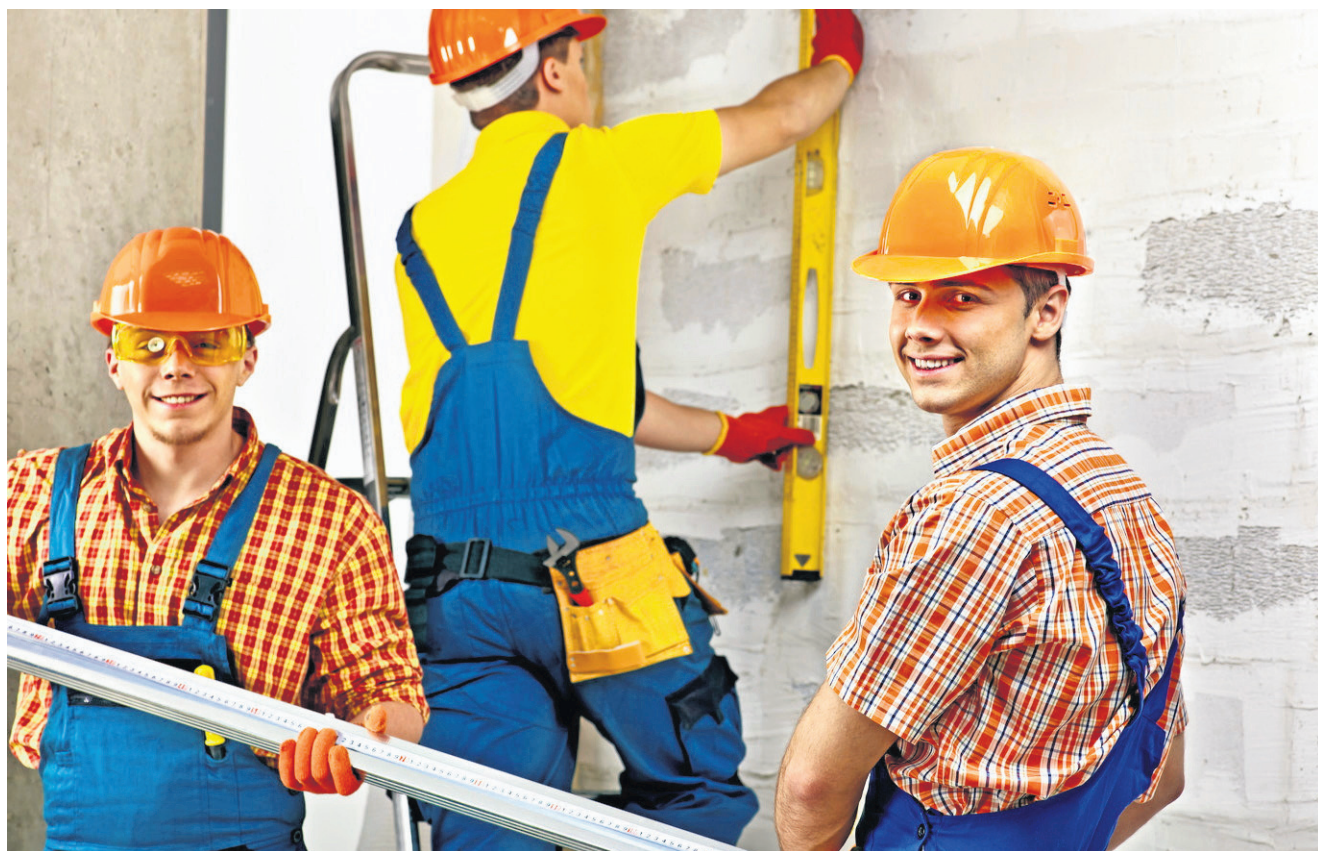
Odbycie zagranicznego stażu to w każdej branży poważny atut na rynku pracy, do tego rozszerza możliwości szukania zatrudnienia

Oprócz staży międzynarodowych niezwykle cenne jest korelowanie teoretycznego kształcenia zawodowego z realiami rynku pracy, czego przykładem są praktyki i staże zawodowe w ramach pozyskanych środków europejskich. W latach 2018-2020 praktyki zawodowe i staże uczniowskie zrealizowało 757 uczniów z 19 poznańskich szkół o profilu zawodowym w ramach projektu „Kwalifikacje zawodowe kluczem do sukcesu - wspieramy rozwój kształcenia zawodowego