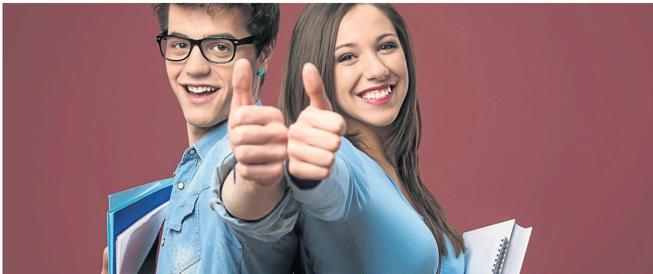
Szkoła branżowa lub technikum to dobra droga do satysfakcjonującej kariery zawodowej i wysokich zarobków

MIT Absolwenci i absolwentki szkół zawodowych mają szansę zdobycia dobrego zawodu z perspektywami podjęcia w przyszłości pracy, która będzie ich satysfakcjonować. Na rynku pracy najbardziej poszuki-