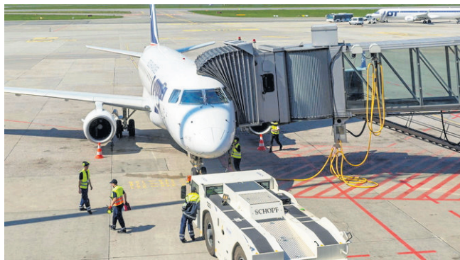
Specjaliści obsługi portów i terminali są bardzo poszukiwani

Potrąfi: ● organizować i monitorować przepływ zasobów i informacji w procesie produkcji ● organizować i monitorować procesy magazynowe ● organizować i monitorować procesy transportowe ● organizować i monitorować procesy dystrybucji ● organizować środki techniczne w celu realizacji procesów transportowych ● organizować i monitorować przepływ zasobów i informacji w jednostkach gospodarczych i administracyjnych ● zarządzać środkami technicznymi podczas realizacji procesów transportowych