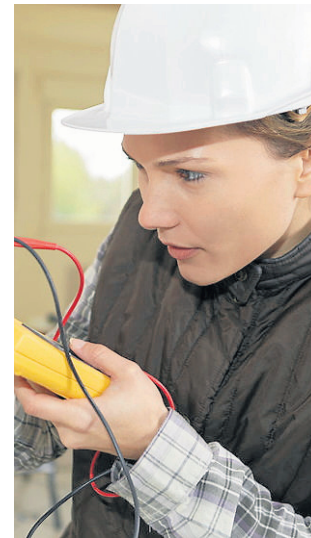
Elektryka i energetyka to nie wyłącznie męska domena