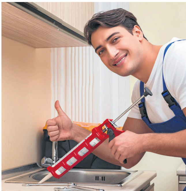
Zapotrzebowanie na wybrany zawód nie tylko obecnie, ale i w przyszłości to ważne kryterium, które należy wziąć pod uwagę

Na stronie internetowej Centrum Doradztwa Zawodowego dla Młodzieży ( www.cdzdm.pl ) zebrano wszystkie te informacje i przedstawiono je w przystępny sposób w zakładce „O szkołach ponadpodstawowych”