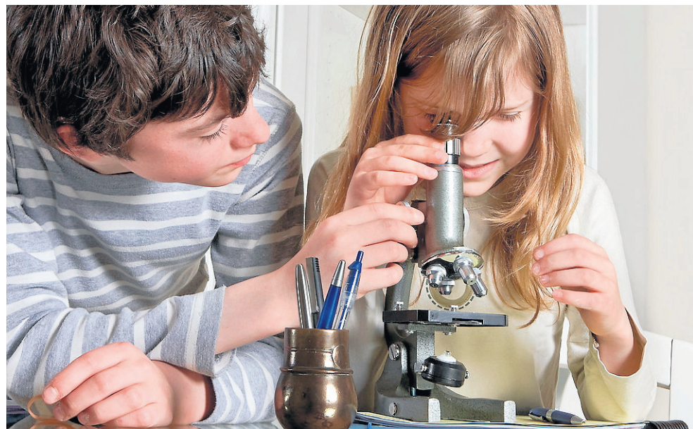
Wybierając zawód warto kierować się swoimi zainteresowaniami i pasjami

Dopiero wtedy skonsultuj się z rodzicami, nauczycielami i innymi ważnymi dla Ciebie osobami. Zanim dokonasz ostatecznego wyboru zawodu, sprawdź, czy wybierasz go na podstawie wiedzy, czy tylko wyobrażenia na jego