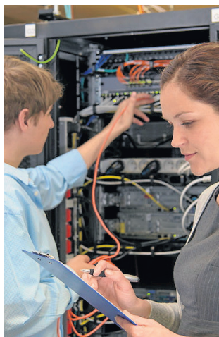
Specjaliści w branży IT należą do najlepiej opłacanych