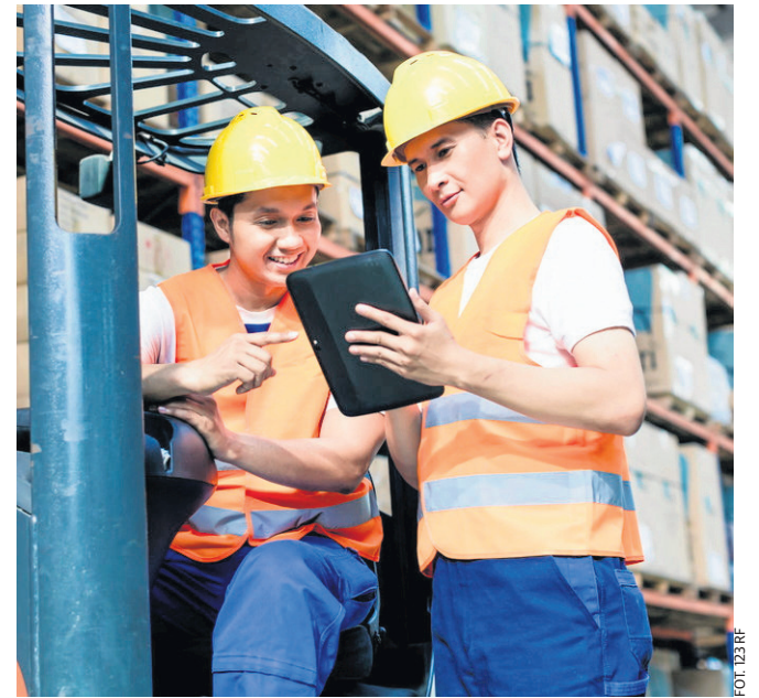
Obsługa nowoczesnych magazynów wymaga specjalistów

Mimo wywołanego pandemią spadku zapotrzebowania na specjalistów w branży turystycznej - według „Barometru zawodów” wciąż nie ma ich w nadmiarze. Na wykształconych fachowców czeka też branża beauty (fryzjerzy, kosmetyczki), branża motoryzacyjna (mechanicy, lakiernicy i inni) oraz gastronomia. Jest więc w czym wybierać. Do dzieła!