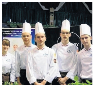
Zdjęcie z Areny Zawodów w hali Arena

Szacun dla zawodowców to zapoczątkowana w 2015 roku kampania Miasta Poznania i Starostwa Powiatowego w Poznaniu promująca wiedzę o zawodach i kształceniu zawodowym.