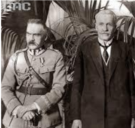
Józef Piłsudski i Ignacy Mościcki