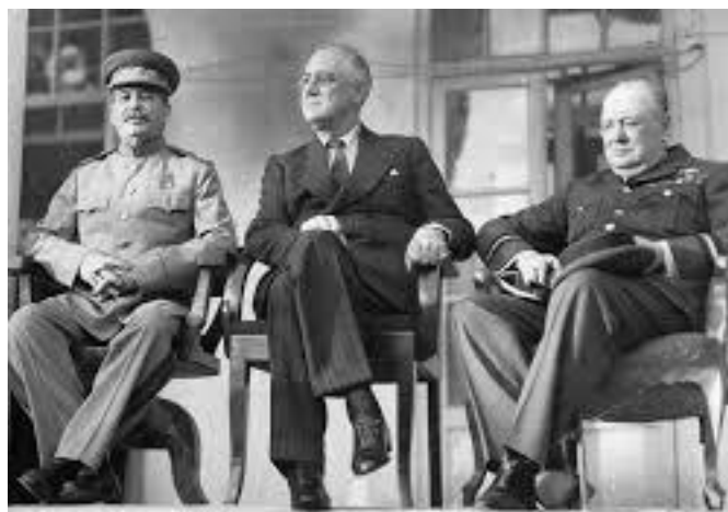
WB – premier Winston Churchill USA – prezydent F. D. Roosevelt ZSRR – J. Stalin