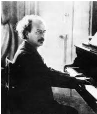
Ignacy Jan Paderewski