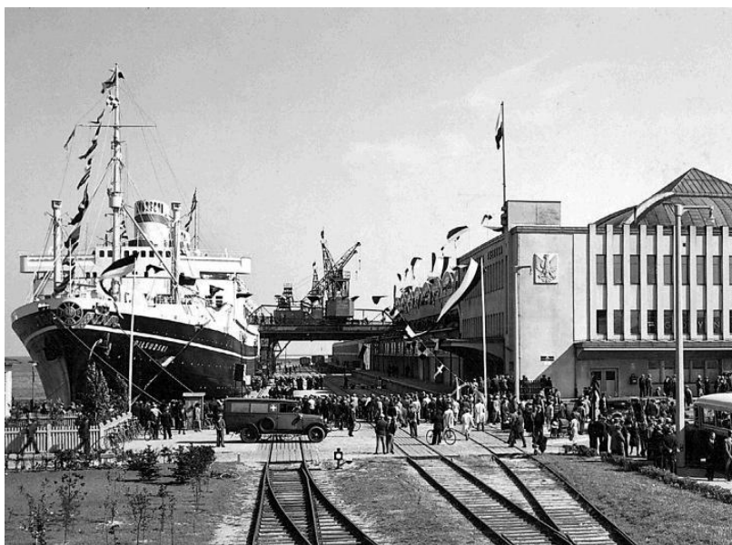
Port w Gdyni – duma II RP.