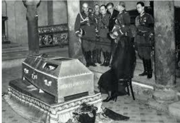
Pogrzeb J. Piłsudskiego na Wawelu.