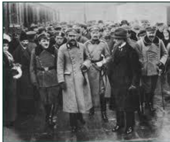
Przyjazd Piłsudskiego do Warszawy